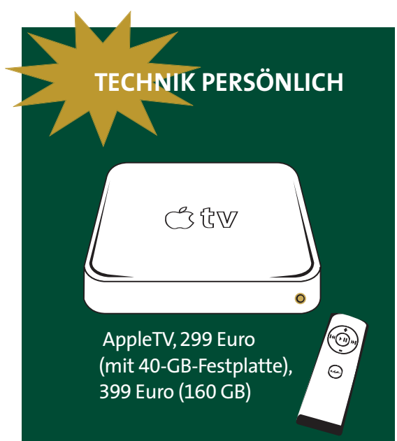
AppleTV, 299 Euro (mit 40-GB-Festplatte), 399 Euro (160 GB)

Prinzip ein Mac, aber der darf längst nicht alles, was er könnte. Um Bilder, Filme oder Töne von externen Speichern zu »streamen«, so das neue Verb, muss ein Computer im Netz sein, auf dem Apples Programm iTunes läuft. Die Daten laufen also von der Festplatte zum Computer, von dort zum TV-Kästchen und dann zum Fernseher.